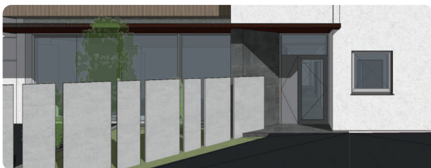
エントランス正面