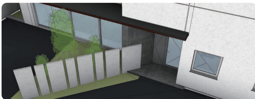
エントランス俯瞰